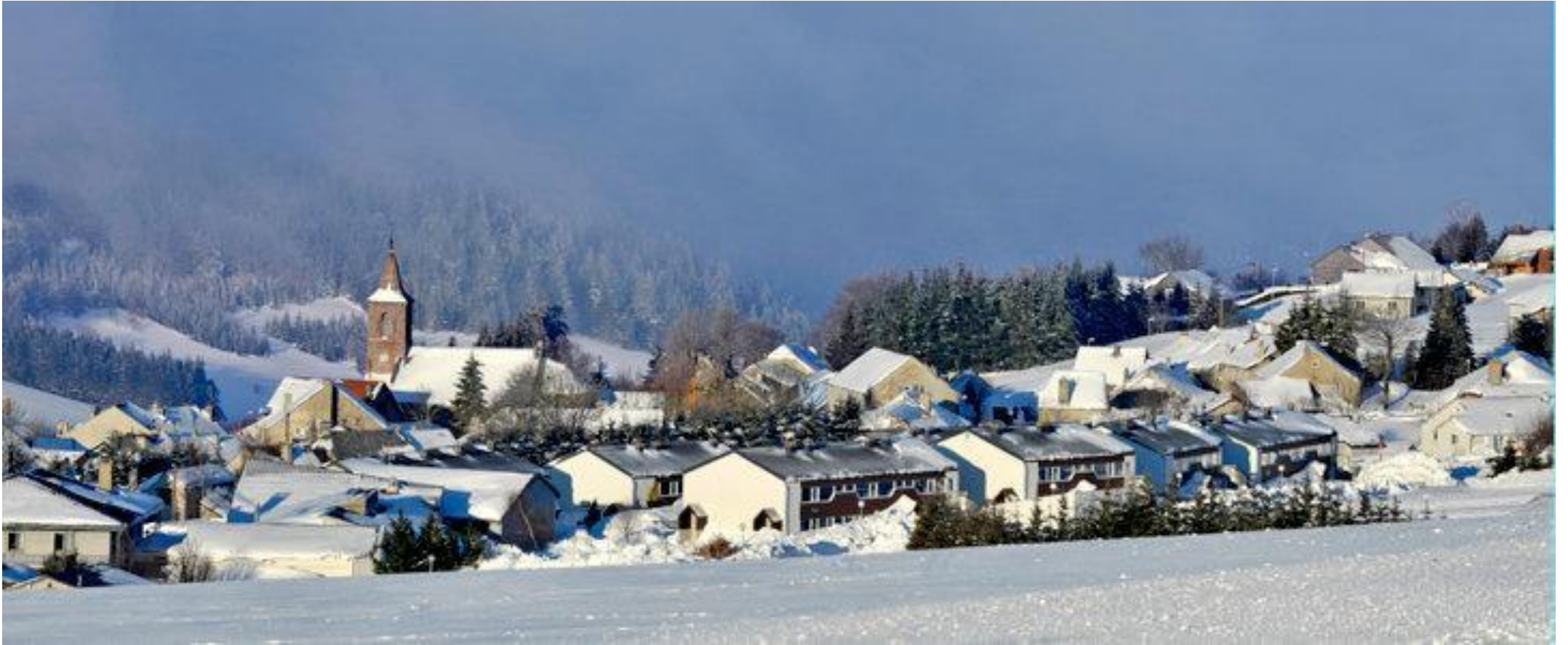
Le village sous la neige