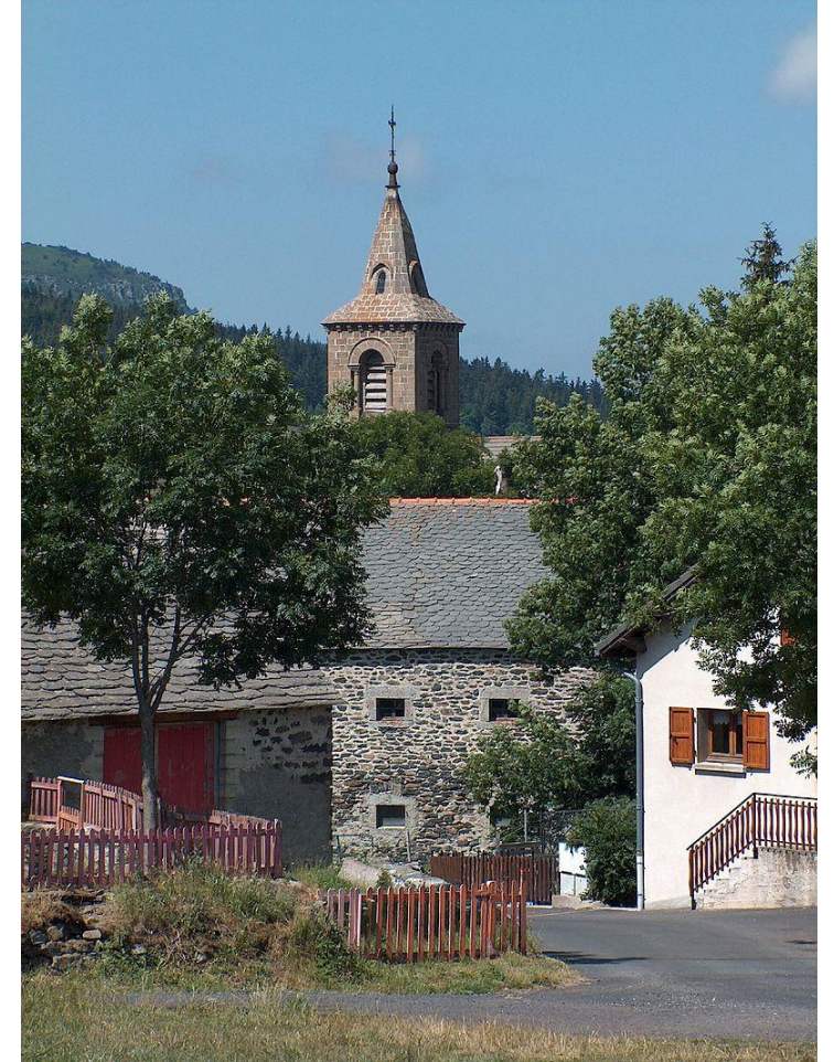
Village des Estables