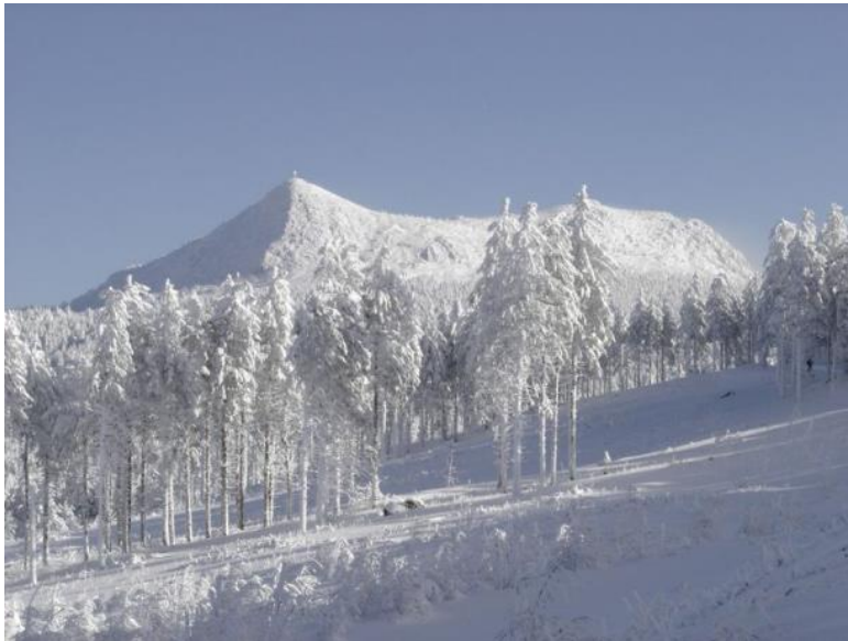
Le mont Mézenc